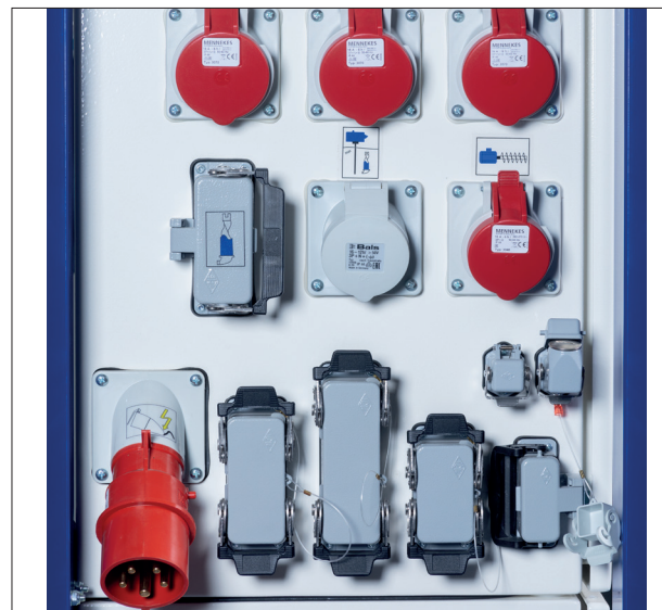
^ Über die verschiedenen Schnittstellen kann die Maschine extern gesteuert werden - willkommen auf der Baustelle 4.0.