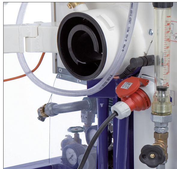
^ Leichte Reinigung und mit der optionalen Übergabehaube mit Siloware beschickbar - so geht wirtschaftliches Arbeiten.